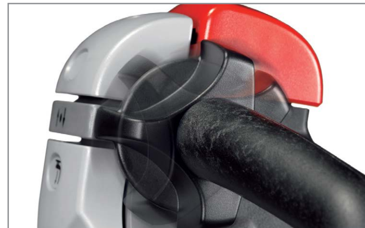
Эргономичный рычаг управления с аварийной кнопкой безопасности