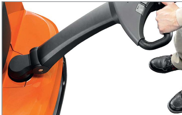
Рукоятка оптимизирована для безопасной работы и защищает ноги оператора от наезда